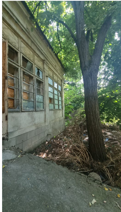
FAȚADĂ NORD - CORP C1