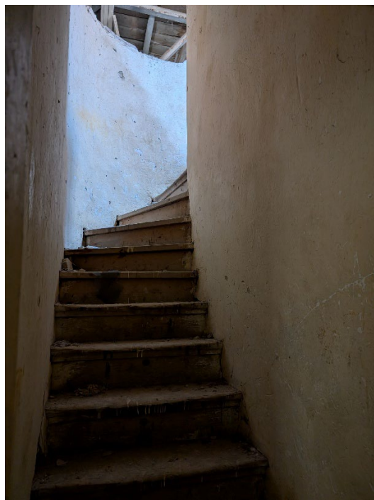
Scara acces pod